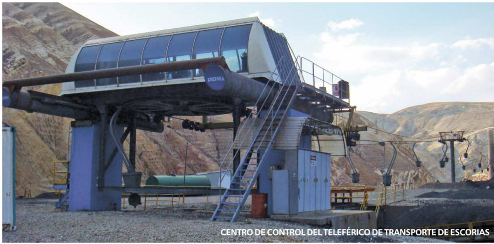
CENTRO DE CONTROL DEL TELEFÉRICO DE TRANSPORTE DE ESCORIAS