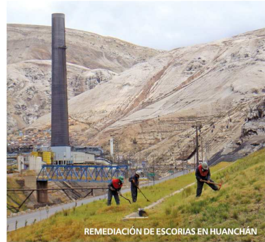
REMEDIACIÓN DE ESCORIAS EN HUANCHÁN

LA VERDAD SOBRE DOE RUN PERÚ Nuestros residuos sólidos, industriales y domésticos, no impactan al medio ambiente