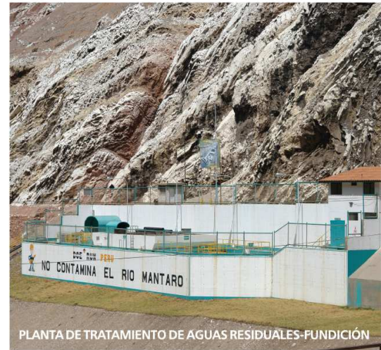
PLANTA DE TRATAMIENTO DE AGUAS RESIDUALES-FUNDICIÓN